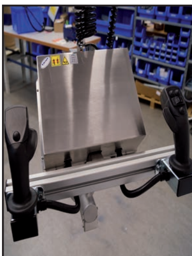
Her håndteres bilruder med dual justerbar joystick