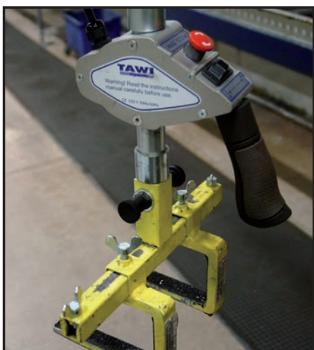
Gaffelværktøj, der anvendes til løft af store aluminiumsprofiler