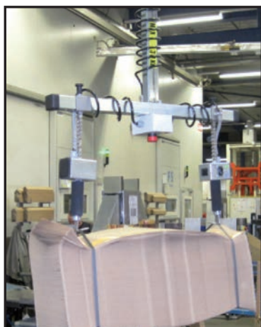
Værktøj til løft af bundter af papirssække