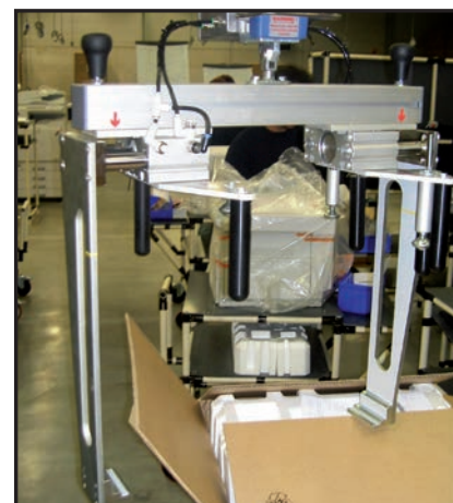
Special værktøj til at håndtere printere