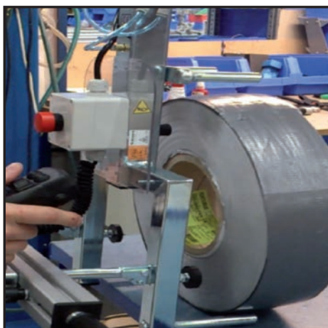
Rullehåndtering med jysterbar joystick