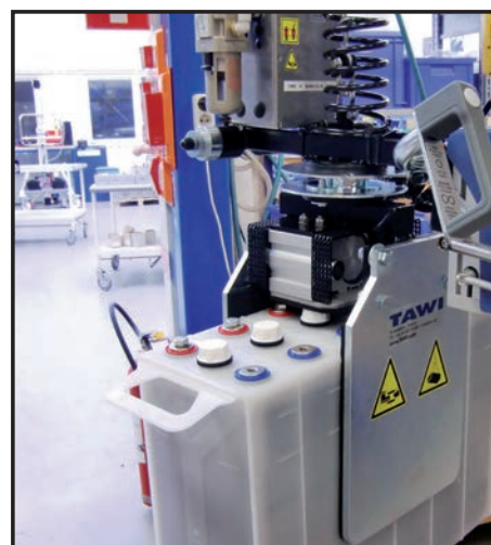
Værktøj til håndtering af industribatterier